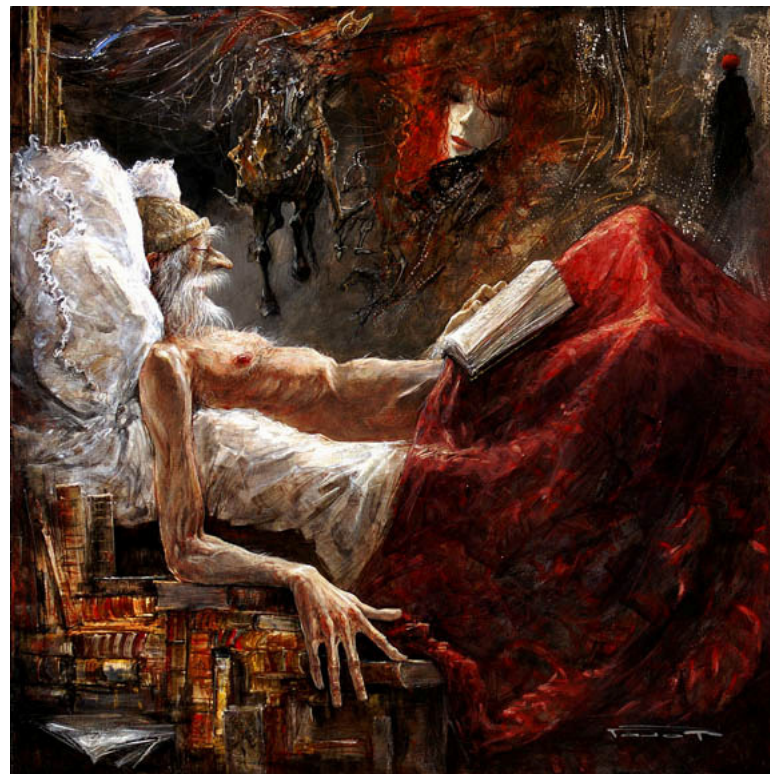
Rêve de gloire, technique mixte, 80x80