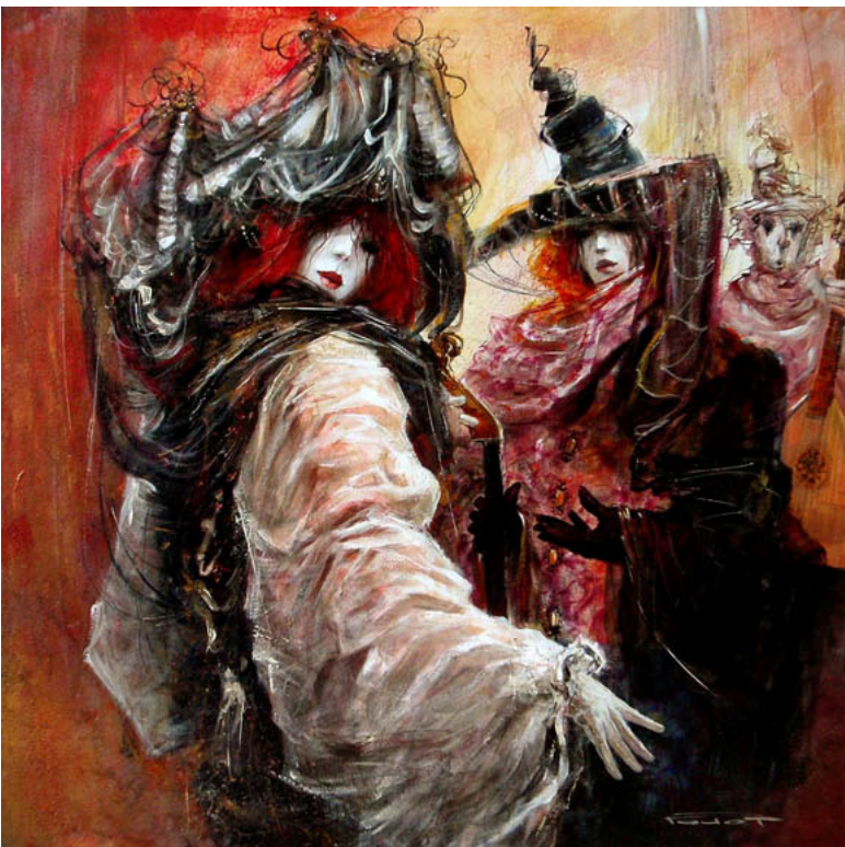
Distraction, technique mixte, 80x80