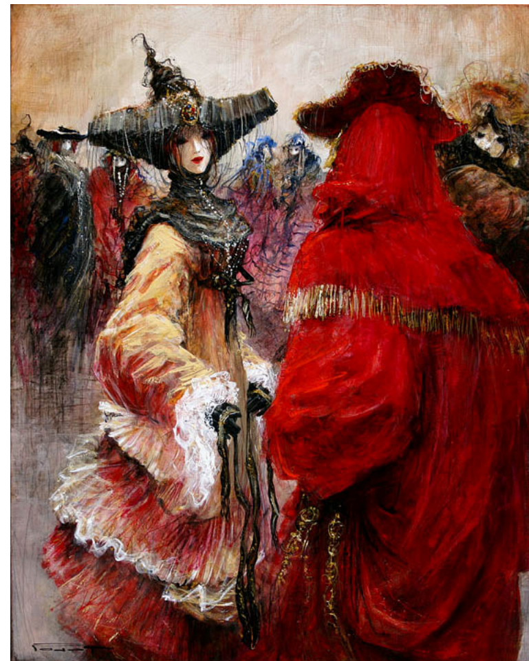
Pourquoi pas ?, technique mixte, 100x81